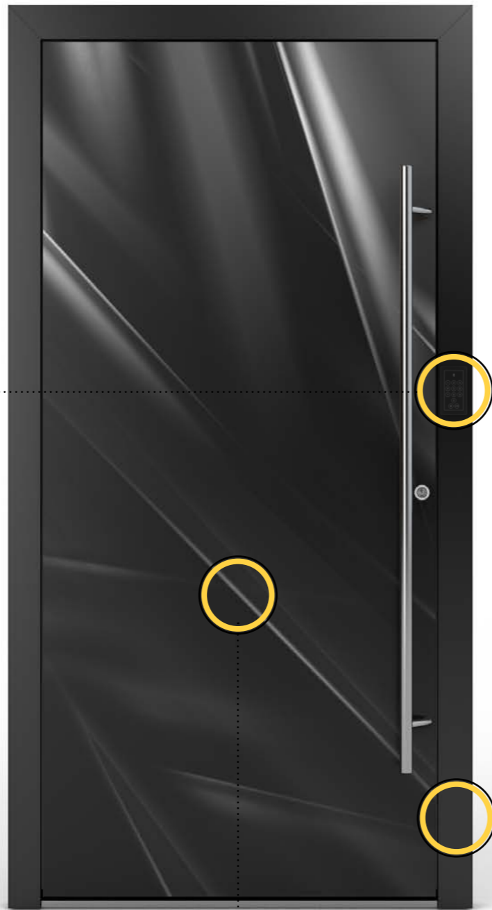
Model 15 | Wzór 1